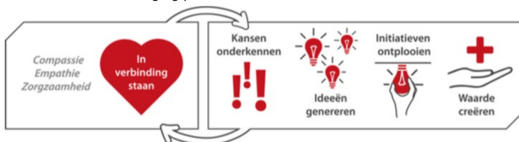
Figuur 1 Componenten Leren Sociaal te Ondernemen (bewerking van figuur zoals opgenomen in Van der Wal-Maris, 2019). 1

In de derde leertaak ga je werken aan jouw bekwaamheid om sociaal te ondernemen in een internationale context. Je doet dit óf in het kader van jouw eigen leren sociaal te ondernemen, óf in het kader van het kinderen leren sociaal te ondernemen. Hierbij het zijn de Componenten van Sociaal Ondernemen het uitgangspunt.