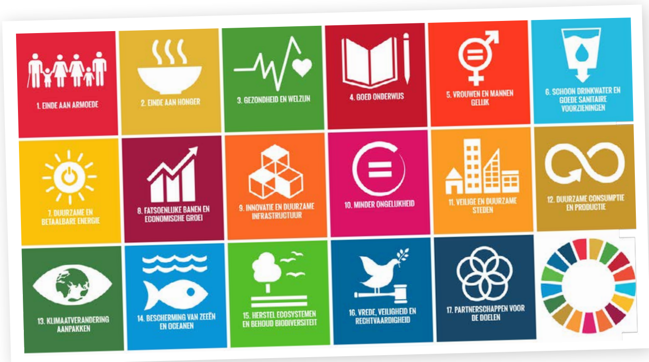
Figuur 1 – Duurzame ontwikkelingsdoelen