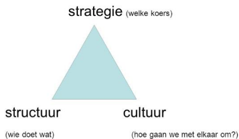
Figuur 1: Samenhang strategie, cultuur, structuur

De kwaliteit die we nastreven wordt bepaald door de geformuleerde strategie van de Marnix Academie en onze visie op kwaliteit (Strategisch plan). De nagestreefde kwaliteit wordt geborgd met behulp van de gewenste cultuur en adequate structuur . Bij het realiseren van de beoogde onderwijskwaliteit streven we naar een sterke kwaliteitscultuur en sluiten we aan bij de kernwaarden van de Marnix Academie bekwaam, betrokken, bevlogen. Dit krijgt vorm in een kwaliteitszorgsysteem waarbij systematisch en cyclisch aandacht is voor de beoogde kwaliteit. Deze drie sterk met elkaar samenhangende en elkaar beïnvloedende elementen (strategie, cultuur en structuur) worden in dit document beschreven. (Zie figuur 1.)